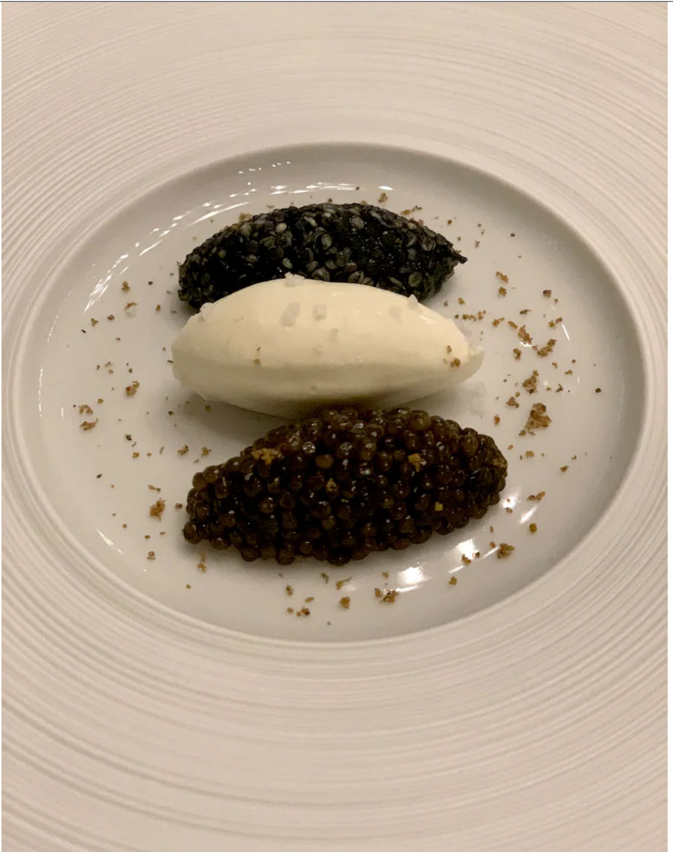
Drei Nocken zum Start: Kaviar, Sauerrahm, Quinoa.