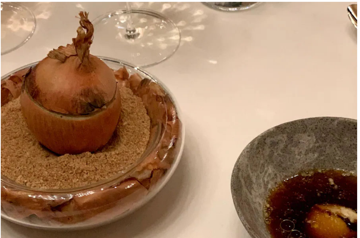
Die Zwiebel-Suppe des Jahres: «Gratinée à l'oignon» by Benoît Carcenat.