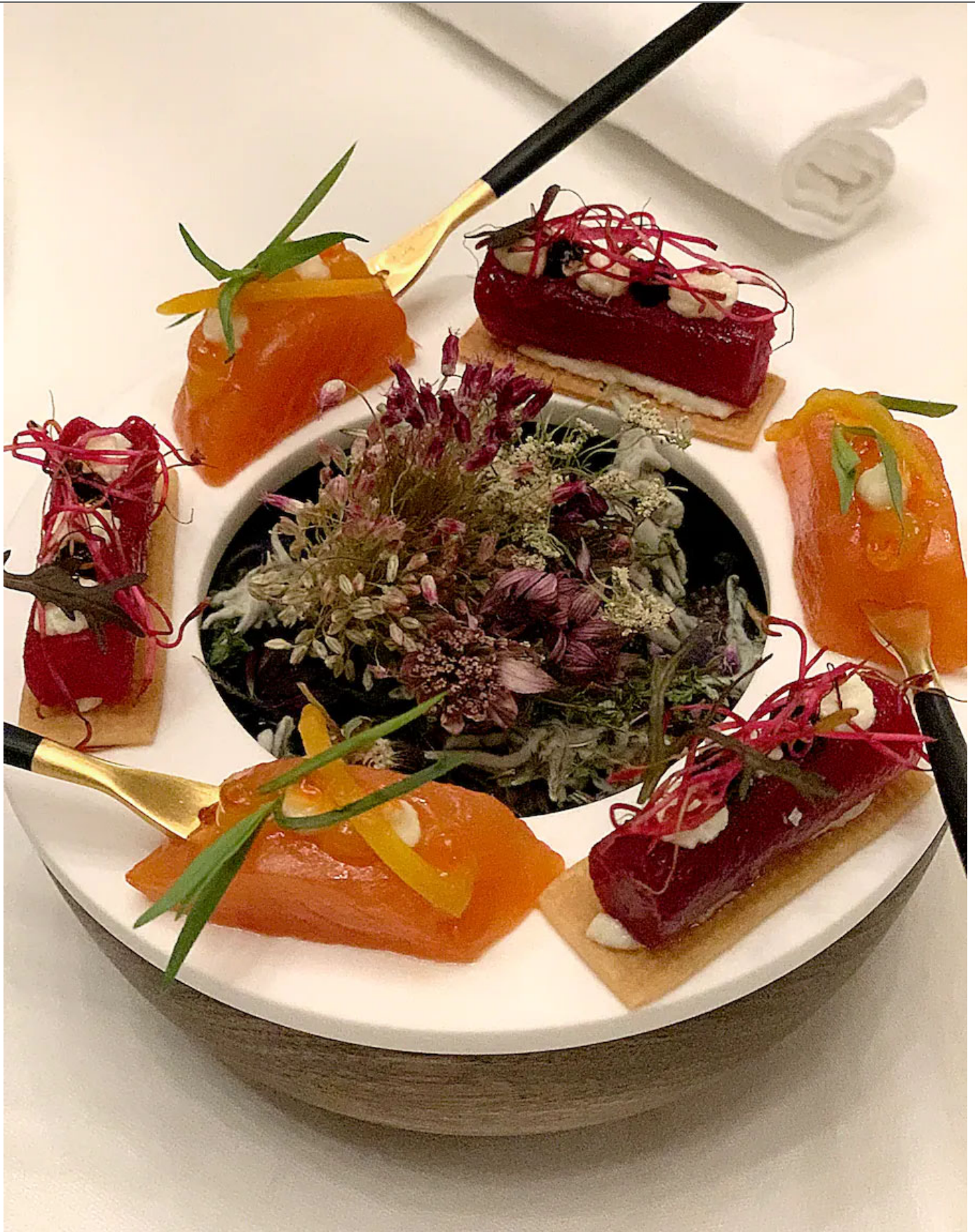
Pinzetten-Arbeit beim Amuse-bouche: Rande und Saibling.