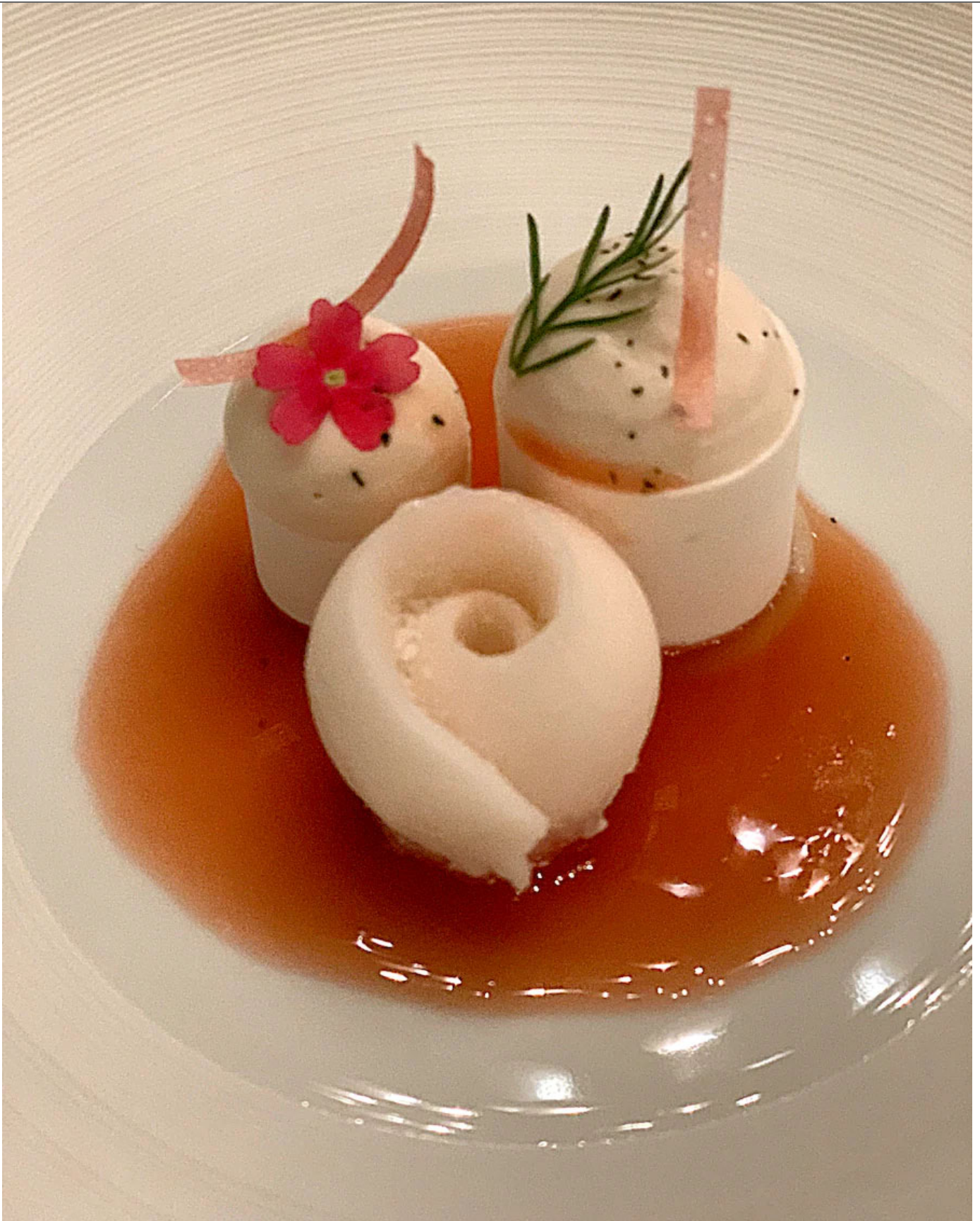
Auch der Pâtissier hat Klasse: Litchi mit Champagner-Glace.

DIE MAGIE DER ZWIEBEL. GEHT NOCH MEHR? Klar doch. Chef Carcenat serviert eine verblüffende Zwiebelbouillon («Gratinée à l'oignon»), an der er mehrere Tage arbeitet: «Ich versuche, dieses traditionelle Bauerngericht neu zu interpretieren und in die Gourmetküche zu transportieren. Mit den gleichen Zutaten, aber mit moderner Technik.» Konkret: Eine ganz «normale» Zwiebelsuppe wird mit riesigem Aufwand geklärt und konzentriert (Carcenat: «Cryo-