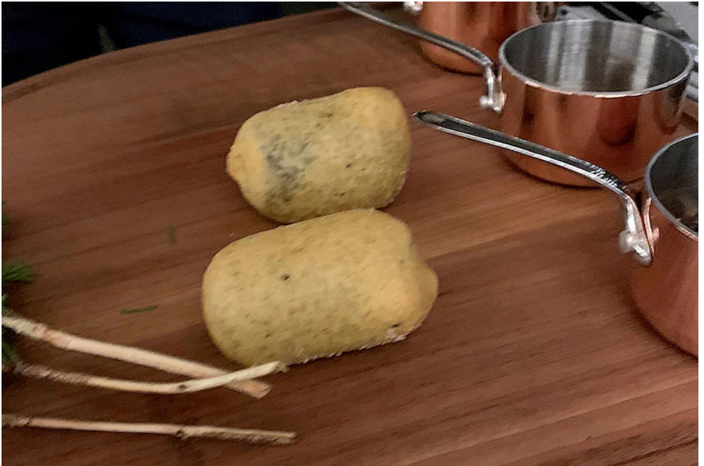
Jakobsmuschel, im Beignet versteckt. Mit Périgord-Trüffel.